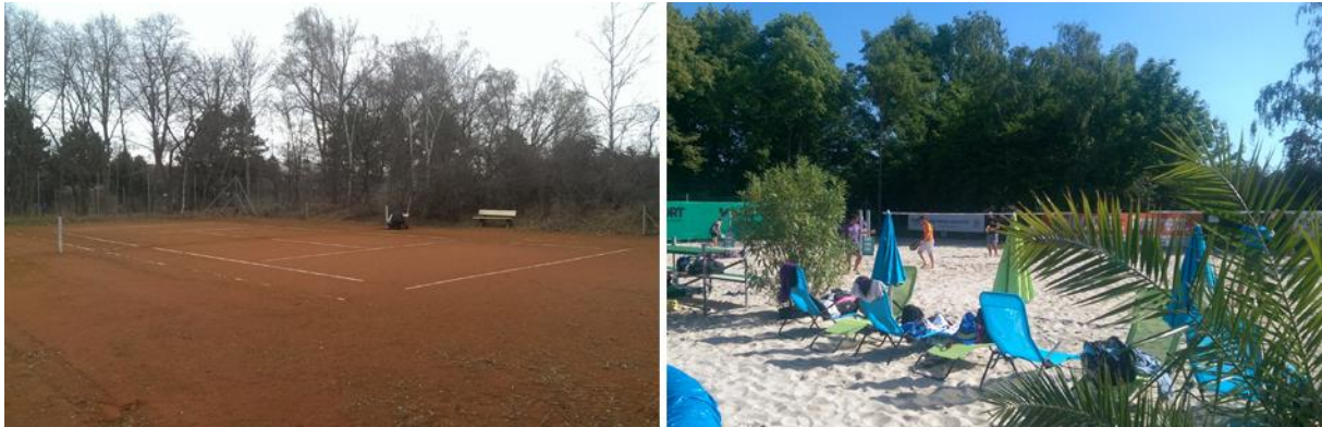
Der TC Boehringer in Ingelheim hat im Frühjahr 2014 zwei Tennisplätze in eine Vier-Feld-Beachanlage verwandelt

Den größten Anteil an den Gesamtkosten bei einem Umbau hat der Sand; für ein Spielfeld der Größe 16x8 Meter müssen Sie inklusive eines Auslaufs mit rund 140 Tonnen rechnen. Bei einer entsprechenden Größe können Sie auf einem Tennisplatz bis zu drei Beachfelder erstellen. Wenn Sie die Befestigung der Netzpfeiler geklärt haben, benötigen Sie nur noch Linien, Netze, Schläger und Bälle – dann kann es losgehen! Auf den Beachfeldern können selbstverständlich auch – zum Teil ohne größere Umbaumaßnahmen - weitere Sportarten angeboten werden: Beachvolleyball, Beachbasketball, Beachbadminton oder auch Footvolley.