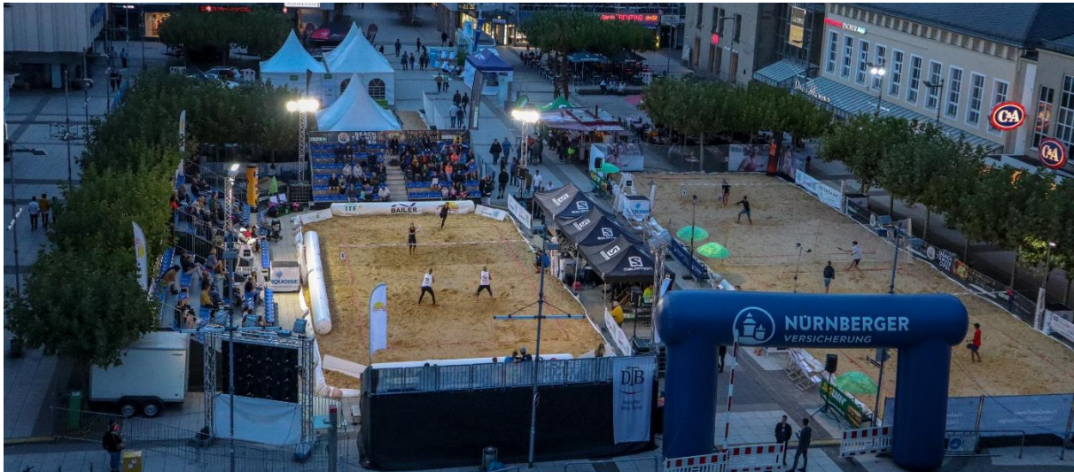
Der Center-Court bei den Deutschen Meisterschaften in Saarlouis im August 2018